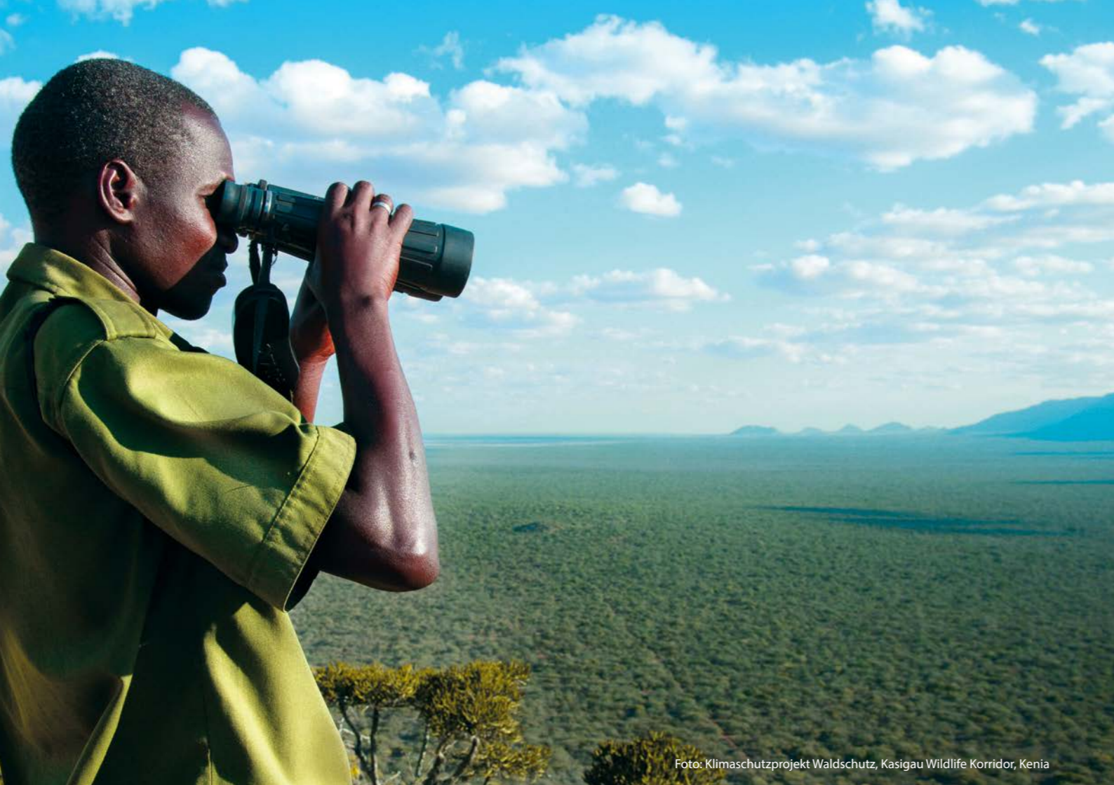
Foto: Klimaschutzprojekt Waldschutz, Kasigau Wildlife Korridor, Kenia