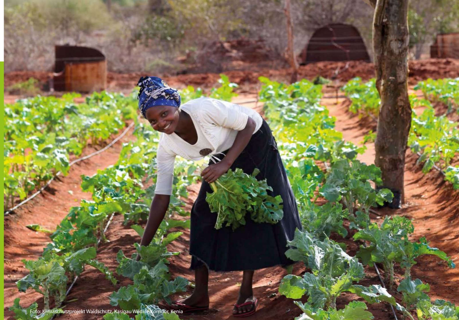
Foto: Klimaschutzprojekt Waldschutz, Kasigau Wildlife Korridor, Kenia