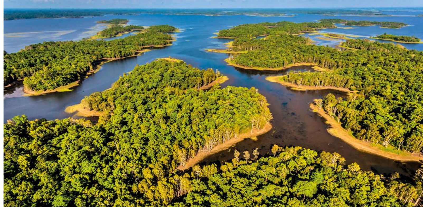
Foto: Klimaschutzprojekt Waldschutz in April Salumei, Papua-Neuguinea

CO 2 -Einsparung in April Salumei: 1,03 Millionen Tonnen pro Jahr