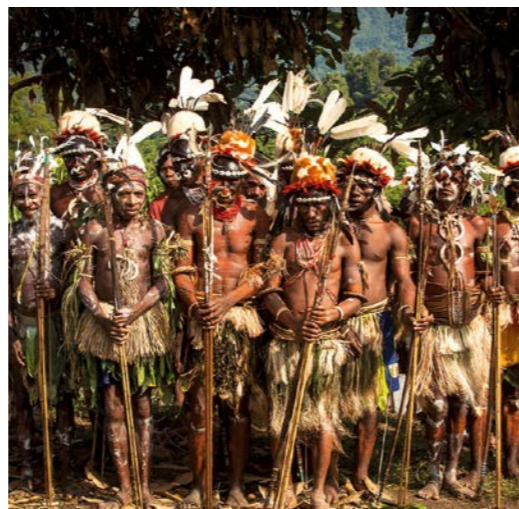
Fotos: Klimaschutzprojekt Waldschutz in April Salumei, Papua-Neuguinea